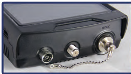
Connettori TV SAT FIBRA