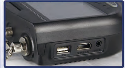
USB HDMI out AV out

F HDMI DVB-S/S2 TASTIERA R ETROILLUMINATA ANALIZZATORE di SPETTRO T2&S2 LCN O RDINAMENTO CH. DVB-T/T2 PORTA USB TORCIA C OSTELLAZIONE T2&S2 A V