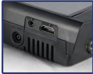
DC out AV in HDMI in